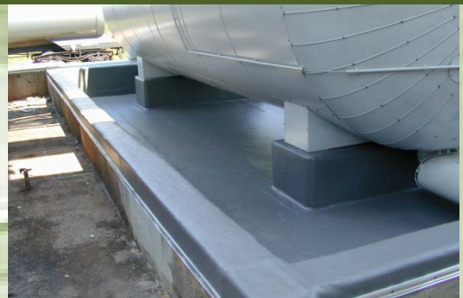
Auskleidung von Leckageauffangräumen

Concrete repair, reprofiling using polymer-modified mortar systems