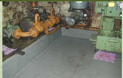
Hochelastische Abdichtung von stark kontaminierten Flächen

Joint sealing using prefabricated polysulphide joint-sealing strips