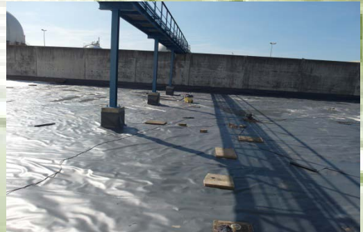
Großflächenabdichtung mit WHG-zugelassenen Folien

Elastic joint sealing as per IVD, DWA (TRwS Technical Rules Applicable to Water Polluting Substances)