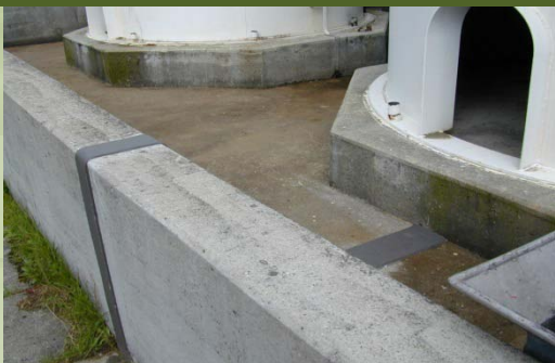
Fugenabdichtung mit vorkonfektionierten Polysulfid-Fugenbändern

Joint sealing using prefabricated polysulphide joint-sealing strips