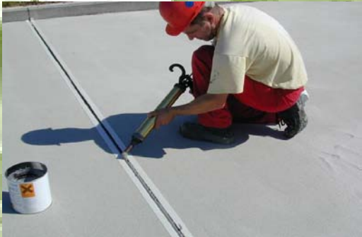
Elastische Fugenabdichtung gemäß IVD, DWA (TRwS)

Elastic joint sealing as per IVD, DWA (TRwS Technical Rules Applicable to Water Polluting Substances)