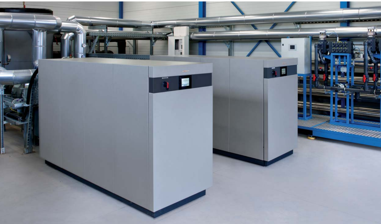
Wärmepumpen Vitocal 350-G Pro mit einer Gesamtleistung von 620 kW