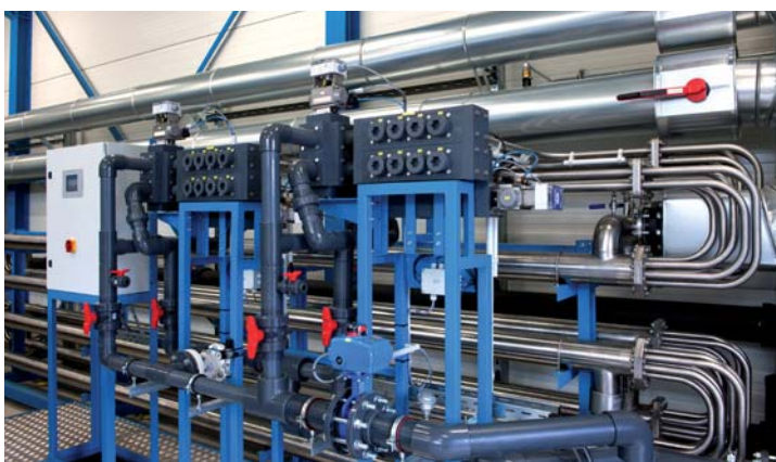
Das DUPUR®-Wärmetauschersystem des Viessmann Partners Jaske & Wolf