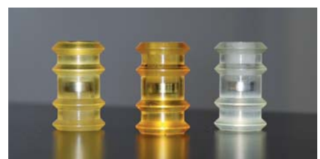
Fingerdick sind die sogenannten Molche aus thermoplastischem Polyurethan (TPU), mit denen der DUPUR®-Wärmetauscher gereinigt wird.